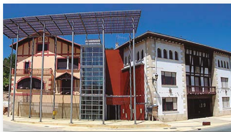
Villanueva de Valdegovía

Es un deporte para todas las edades, en el cual las personas participantes tienen que buscar una serie de lugares marcados en un mapa con unos círculos denominados controles o balizas, ayudados únicamente por un mapa y una brújula (no es imprescindible).